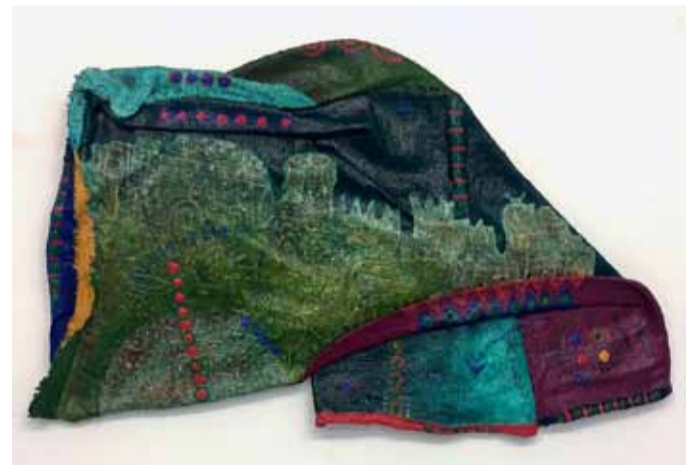
Textilkunst von Moosa Omar: Dieses Werk wird am 5. November bei Jens Hotzel versteigert.

Die Werke werden als künstlerische Vision vorgestellt, bei der Farben auf Jute verwendet werden, die die Rauheit alter Strukturen mit tiefer Reflexion kombiniert. Diese Kombination führt uns zu einer früheren Zeit, wo man die Geschichte fühlen und ihre Geschichten hören kann. „Kunst ist aus meiner Sicht nicht nur ein Instrument zur Meinungsäußerung und Kommunikation mit anderen, sondern eine verborgene Kraft der Seele“, so Moosa Omar. „Kunst schafft eine Welt parallel zum wirklichen Leben“.sabi/zg