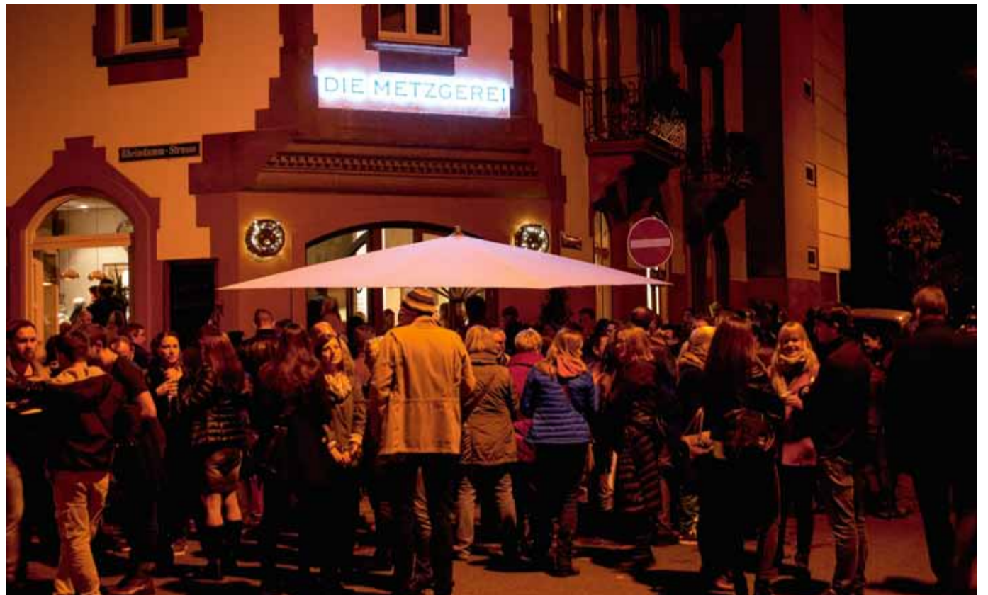
An der „Langen Nacht“ am 5. November werden auch die Straßen des Stadtteils wieder voller Leben sein.