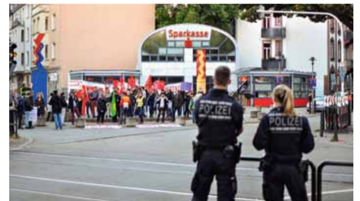
Einsatzkräfte der Polizei beäugten die Protestaktion der AfD-Gegner, die aber sehr friedlich blieb.