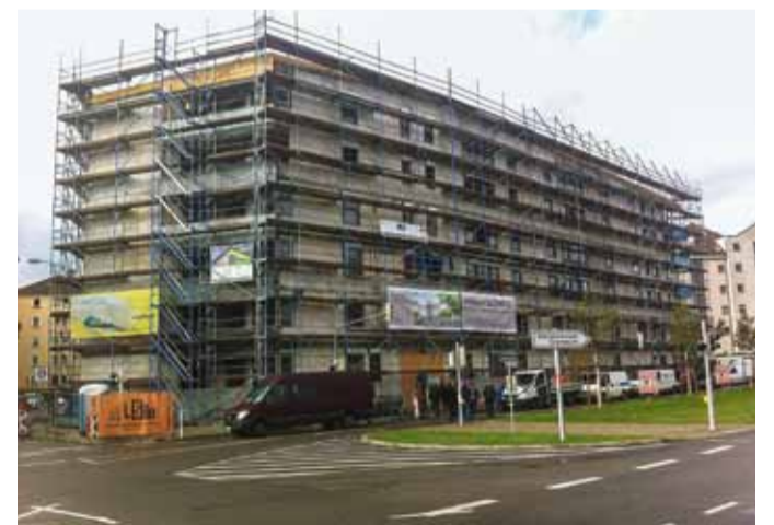
Das „Haus im Glückstein“ wird voraussichtlich das erste Wohngebäude im Quartier sein, in das 2017 die ersten Bewohner einziehen können.

„Es ist ein wichtiges Projekt für das Glückstein-Quartier und für den gesamten Lindenhof. Aufgrund seiner zentralen und exponierten Lage wird es eine prägende Wirkung für das Quartier haben“, betonte Baubürgermeister Lothar Quast beim Richtfest des neuen Wohnprojektes. Zudem sei das Haus im Glückstein auch ein großer Beitrag zu dem, was „wir uns für das Quartier hier immer erhofft hatten“, so Quast, „nämlich eine gute Mischung aus Bau und Gewerbe. Demnächst wird der Bau für das Parkhaus gegenüber richtig loslegen, an die Planungen für das Technische Rathaus – ebenfalls gegenüber – haben wir vor kurzem auch einen Knopf gemacht“. Quast betonte zudem die enorme Nachfrage nach Wohnraum, „die Zahl der Beschäftigten