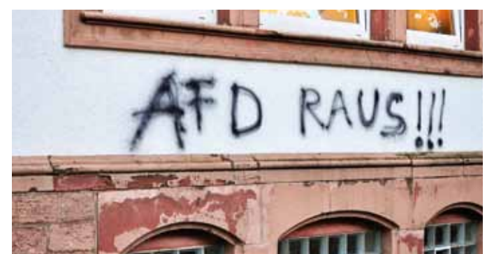
Vor der Veranstaltung der AfD wurde die historische Lanz-Kapelle von Unbekannten beschmier.

In einer offiziellen Stellungnahme der BIG zu den Vorkommnissen hieß es unter anderem: „Die BIG Lindenhof ist ein vor 25 Jahren gegründeter, als gemeinnützig anerkannter Stadtteilverein. Bei der BIG ziehen Bürger aus allen sozialen Schichten und ungeachtet ihrer politischen Ausrichtung an einem Strang und agieren für die gemeinsame Sache.“ Der für die Lanz-Kapelle zuständige Vorstand habe das Thema der politischen Veranstaltung als auch die Referentin hinterfragt. „Inhaltliche Ausrichtung als auch handelnde Personen gaben keinen Anlass, das Prinzip der Gleichbehandlung zu durchbrechen“, so die BIG. Sie gibt an, die Kapelle auch an Externe zu vermieten, wobei der Vorstand nicht alle Meinungen der Mieter vertritt, die diese in öffentlichen Veranstaltungen verlautbaren würden. Der Vorstand der BIG Lindenhof verurteilte jede Art von Diskriminierung auf das Schärfste. „Wir distanzieren uns von jeglicher Art von Fremdenfeindlichkeit jedweder Gruppierung, politischen Partei oder sonstigen Institution“, heißt es. jm