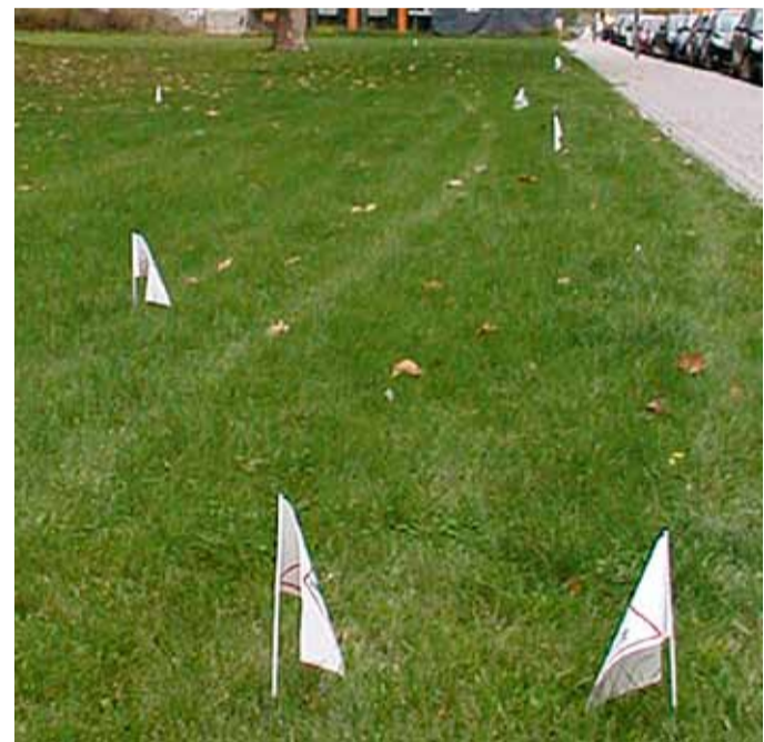
Eine Fähnchenaktion sollte vor kurzem auf die „Tretminen“ im Glückstein-Park aufmerksam machen – deshalb werde der Bolzplatz gebraucht.

„Der Bolzplatz auf dem Hanns-Glückstein-Platz muss erhalten bleiben“, so Taubert (Mittelstand für Mannheim und Mitglied der Fraktion der Freien Wähler-Mannheimer Liste), der getroffene Beschluss der verantwortlichen Gremien ist falsch und sollte geändert werden. Was den beiden BIG-Mitgliedern und dem Stadtrat vor allem missfällt, ist die Argumentation der Stadt, warum der Platz weichen soll: „Die Verwaltung nennt hierfür gestalterische Gründe und hält den Erhalt des Platzes als nicht angemessen. Die Kinder sollen, so ist es vorgesehen, im Gras kicken“, so der Wortlaut einer Pressemitteilung. Der bestehende Bolzplatz ist eingezäunt, die Kinder können unbeschwert spielen. Er bietet einen gewissen Schutz vor Schmutz und vor allem vor den berüchtigten „Tretminen“ – also Hundekot. Dass dies in dem Park durchaus ein Problem ist, sollte vor kurzem eine kleine Aktion verdeutlichen: Kähler, Welker und Taubert haben auf dem Platz die „Tretminen“ mit weißen Fähnchen markiert. Wolfgang Taubert meint: „Welche Eltern lassen zu, dass ihre Kinder auf einem verschmutzten Rasen spielen, wo Ekel und Gesundheitsgefahren drohen?“ Nach der geplanten Neugestaltung wird der Dreck und Kot nicht verschwinden. Auch sollte man sehen, dass der Bolzplatz mal eine Menge Geld bei der Errichtung sowie beim Unterhalt gekostet hat und es keine wirklichen Gründe zum Abriss gibt. „Gestalterische Gründe und ‚nicht angemessen‘ ist da ein bisschen dekadent“, so Taubert abschließend.